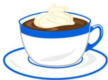
un chocolate caliente