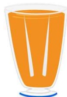
un zumo de naranja