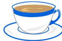
un café con leche